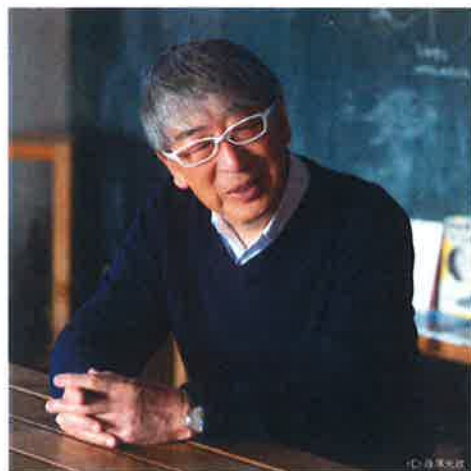
伊東 豊雄 伊東豊雄建築設計事務所 (百島支所・向東認定こども園)